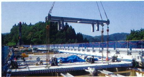
プレストレストコンクリート床版架設

損傷した鉄筋コンクリート床版を、より耐久性の高い床版に取り替えます。 (プレストレストコンクリート床版)