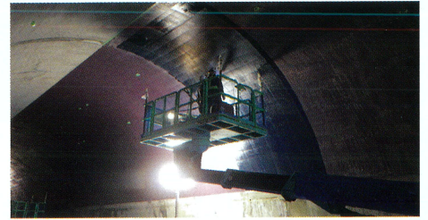
炭素繊維シート貼付