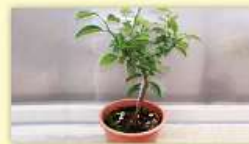
カンキツ類の苗木

詳しくは、事前に裏面★印の植物防疫所にお問い合わせください。なお、現在小笠原諸島には蒸熱処理施設がありません。