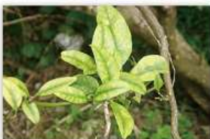
カンキツグリーンング病菌 (病気の症状)