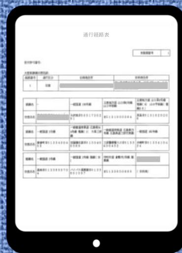
電子媒体による許可証

特殊車両通行許可証等※1（以下「許可証」という。）は、道路法※2において、通行時に携行することが義務付けられています。