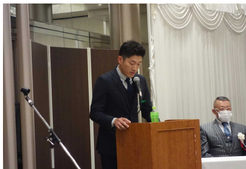
司会 (井町副部会長)