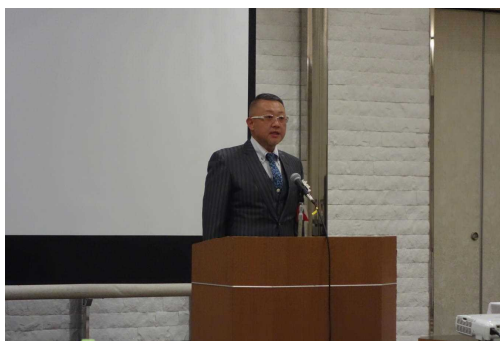
開催地挨拶 (濱田部会長)

会場並びにオンラインにてご参加いただきました当県青年部会員の皆様にお礼申し上げます。